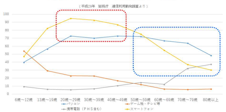
年齢別インターネット接続端末 使用図